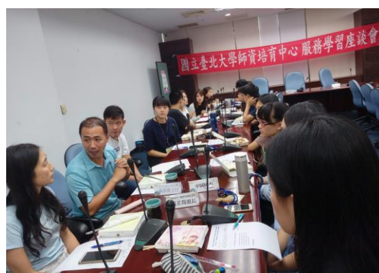
受服務學校代表與修課同學討論服務事宜