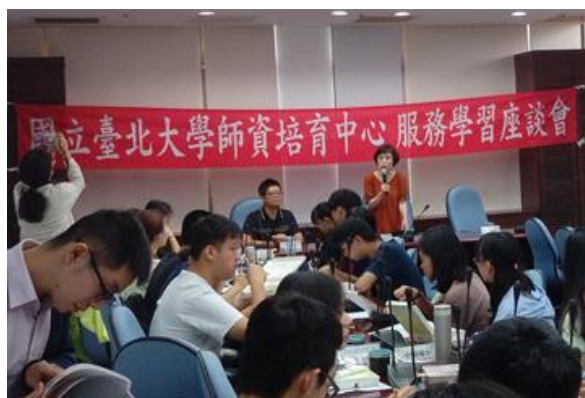
授課教師介紹受服務學校代表