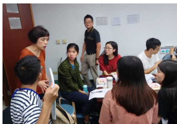
授課老師對修課同學說明服務須知