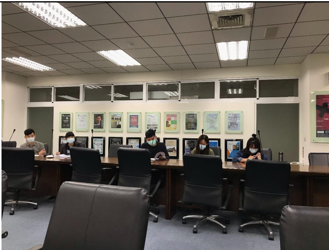
2020年10月28日(週三)日本法導論論壇演講活動(六)——日本公法導論參與演講的學生專注聽講。