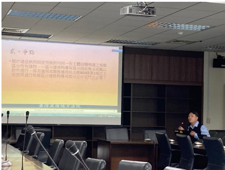
第六場次臺灣高雄地方法院饒志民法官進行報告