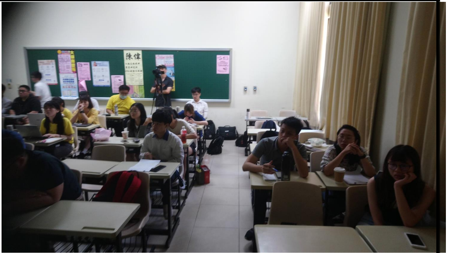
其他同學在台下聆聽成果發表