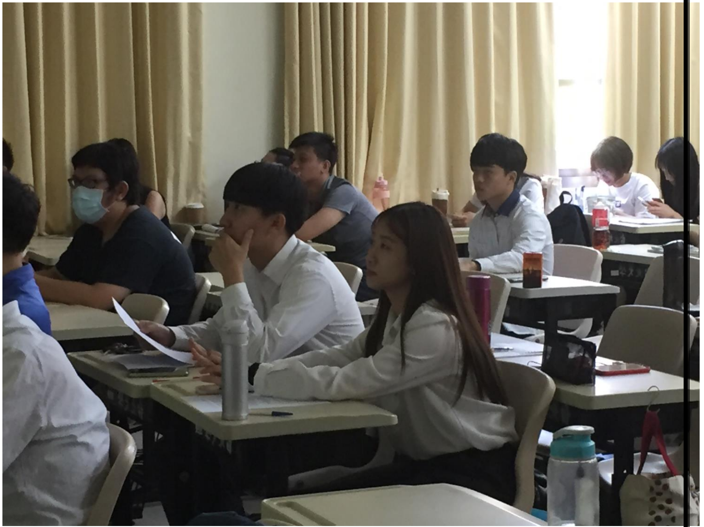
同學在台下聆聽其他組別的成果發表