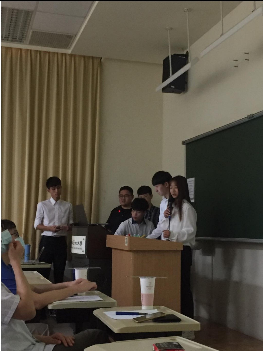
同學在台上分享成果報告