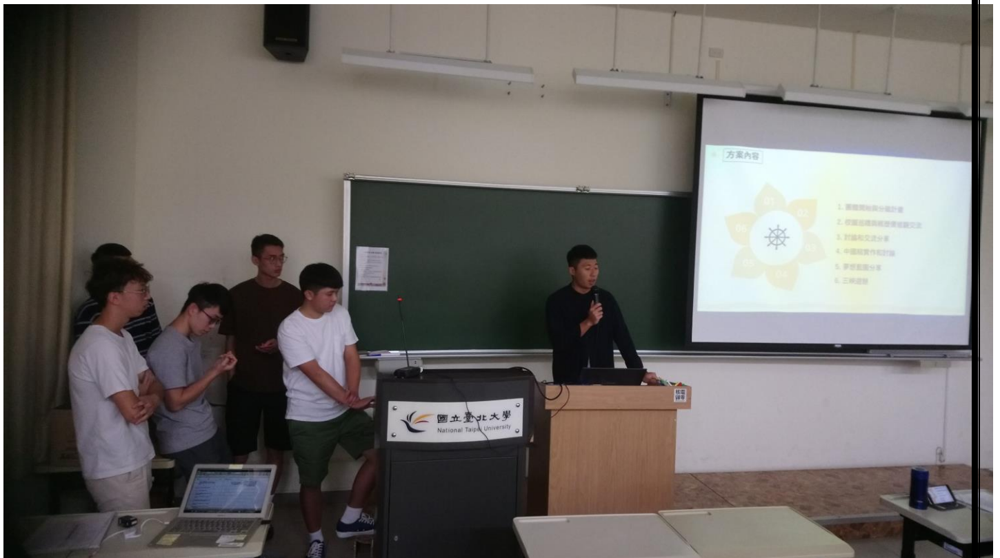
同學在台上分享成果