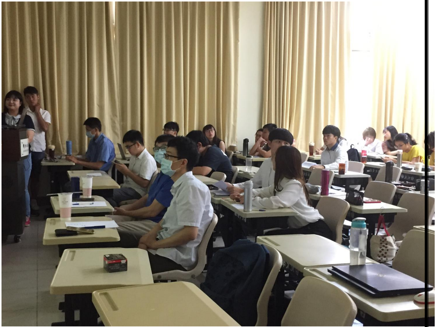
評審老師在台下聆聽成果