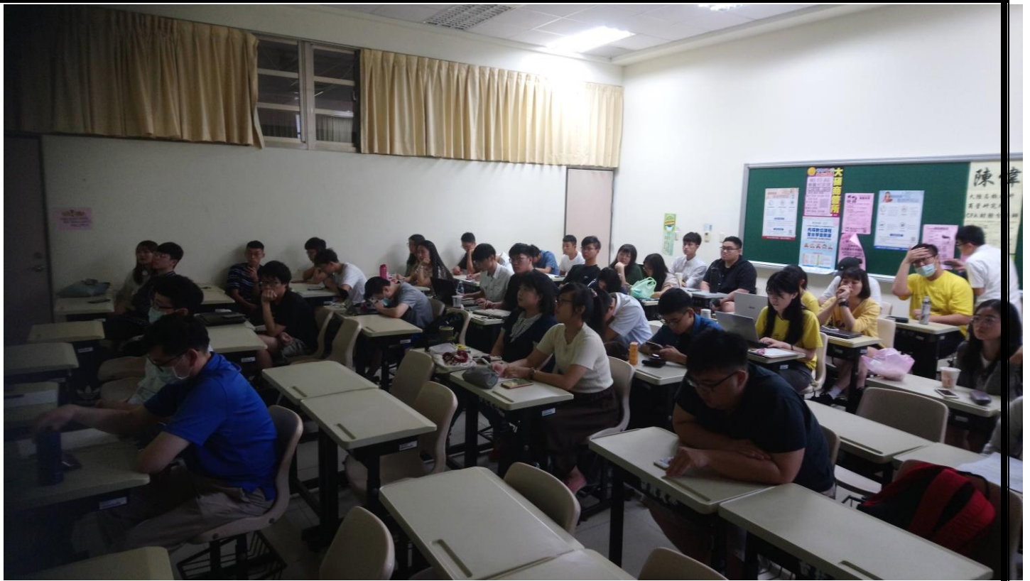
其他同學在台下聆聽成果發表